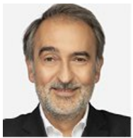
Hervé Hélias, Chairman Based in France

Станом на 31 серпня 2025 року до складу GGB входило 15 членів, серед яких було двоє зовнішніх незалежних членів, а співвідношення жінок і чоловіків становило 1:2.